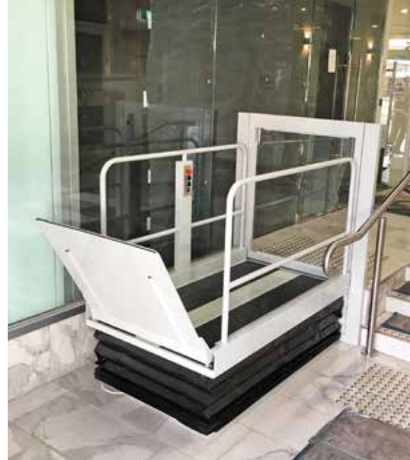
Version mit Tür an oberer Haltestelle , erhöhten Barrieren und Bediensäule