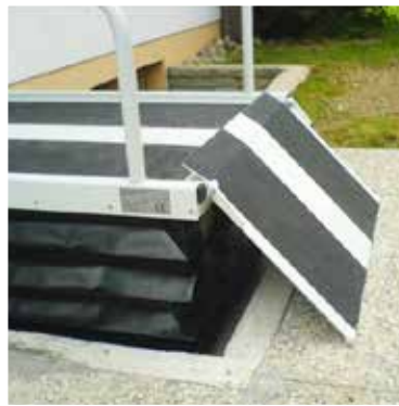
Option: Manuelle Auffahrrampe , klappt beim Heben nach unten und bietet somit einen Abrollschutz