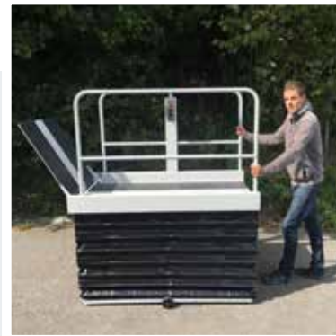
Option: Transporträder ideal für unterschiedliche Einsatzorte